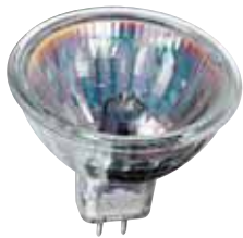
Lampada alogena tradizionale Traditional halogen lamp 12Vac - 20÷60W