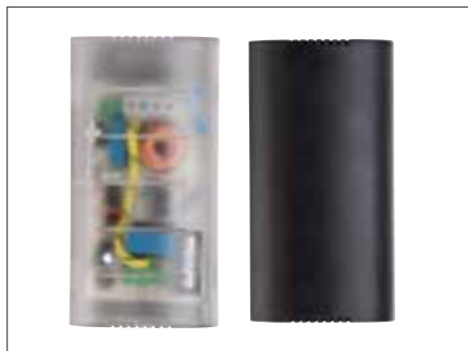
Dimensioni (mm) - Dimensions (mm)