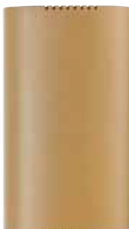
RT78SC LED P Cod. RN0142/LED