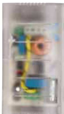
RT78SC LED T Cod. RN0141/LED