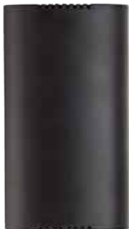
RT78SC LED N Cod. RN0145/LED